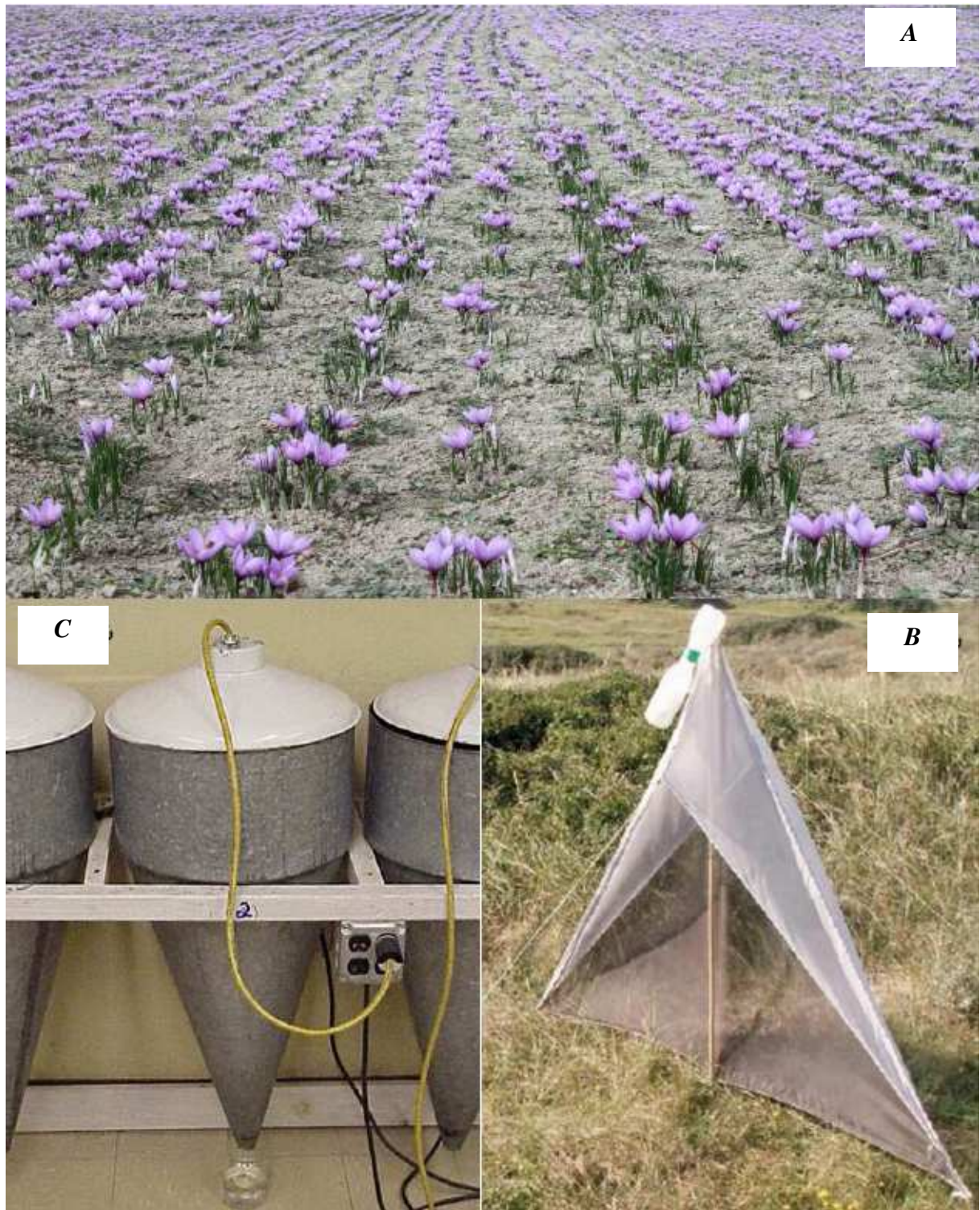
شکل ۱. مزرعه زعفران (الف)، تله مالیز (ب) و کیف برلیز (ج)